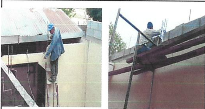
Foto1: Subiendo dos hiladas de Block para mejorar la colocacion del Nuevo Techo.